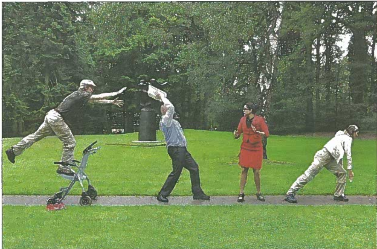
Theatergroep Kwatta tijdens een voorstelling in het beeldenpark van het Kröller-Müller.

Met veel humor, zang en dans laat Kwatta kinderen ontdekken dat je kunst op veel manieren (en heel persoonlijk) mag beleven. En het werkt: het jonge publiek kijkt gebiologeerd toe en luistert ademloos naar het lied Muze Amuse . De Nijmeegse theatergroep werkte eerder op deze educatieve wijze samen met Museum Het Valkhof. Behalve als vrije voorstellingen in oktober wordt Kijk, daar drijft een Pan gespeeld voor schoolklassen (groep 5 t/m 8). Echt jammer, deze herfstige timing, want een beetje zon werpt letterlijk een heel ander licht op deze speelse openluchtkunst.